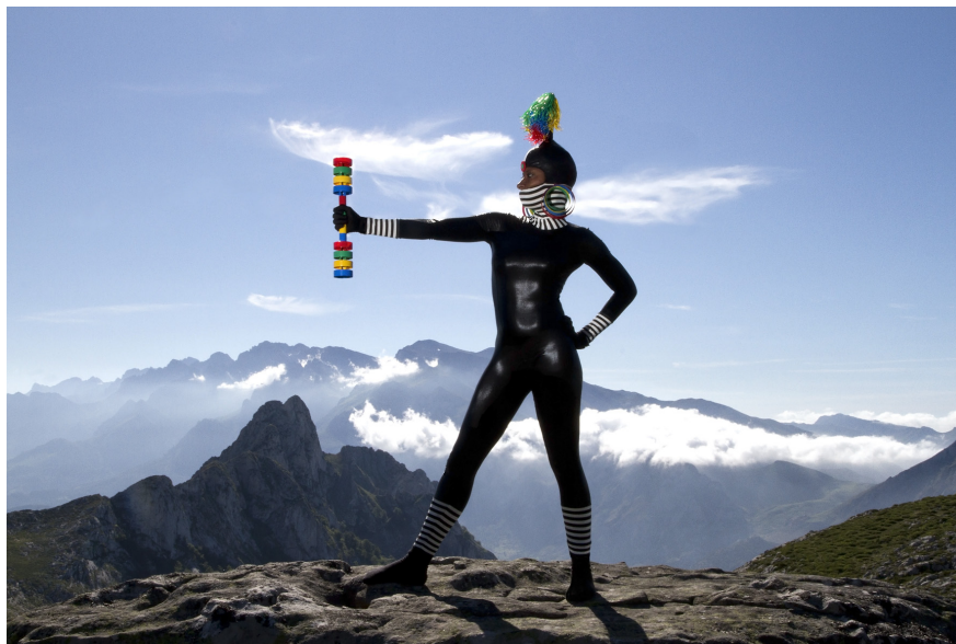
From left: 'Special Moment', Lambda Print 18"x 24", 2013; 'Chrystelle', Lambda Print 24"x 36", 2013

Nueva York, Nueva York, 14 de enero de 2013. 'Munch Gallery se complace en anunciar la exposición individual 'Special Moment' de Bubi Canal '.